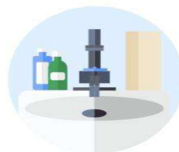
Suplir los sanitarios