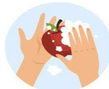
Lavar los alimentos