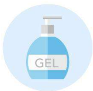
Disponer de gel alcoholado