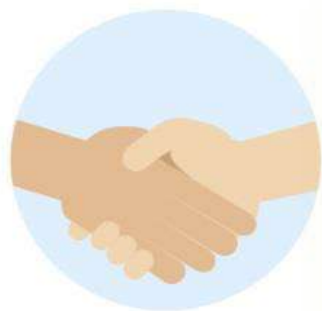
Evitar el saludo