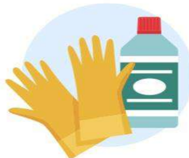
Desinfectar las superficies