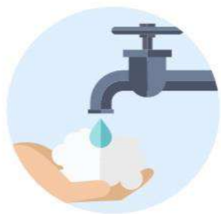
Higiene de mano