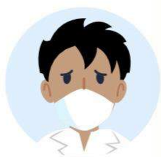
Cubrir la nariz y boca